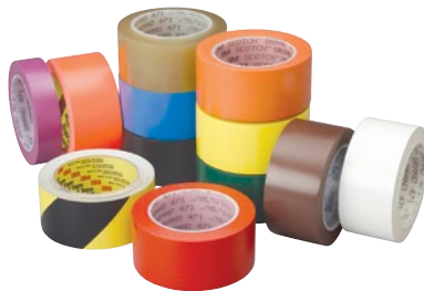
Prix par rouleau