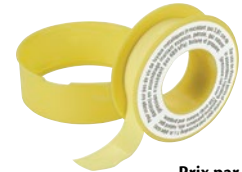
Prix par rouleau