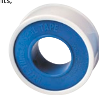
Prix par rouleau