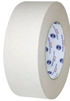
Prix par rouleau